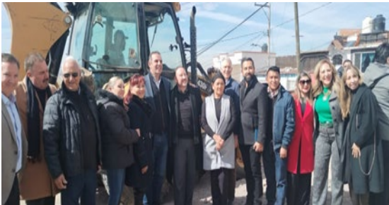
Inicio de los trabajos del parque coanzame de la colonia Reforma