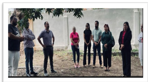
Solicitud de los vecinos de la privada villa blanca para obtener permiso de que la colonia tenga acceso privado