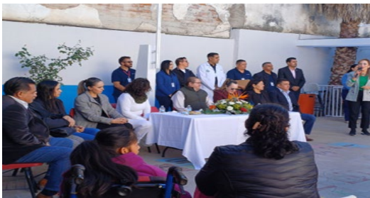
El presidente Municipal, Autoridades Educativas, Dependencia del Dif, Dirección de Medico cerca de ti Regidora de Salud.