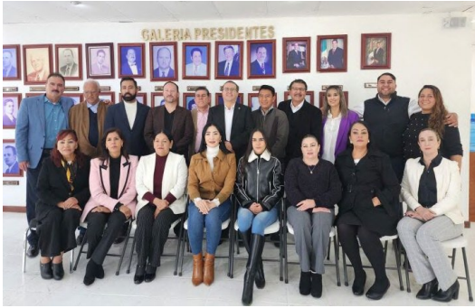
Ultima reunión de cabido 2024