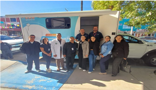
Centro de atención múltiple Rafael Ramírez No. - 7004 25/10/2024