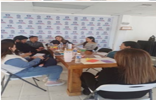
Mesa de trabajo con relación a conocer las inquietudes de algunos maestros cual es la situación que impera en las escuelas en la implementación de que existan psicólogos en las instituciones Educativas