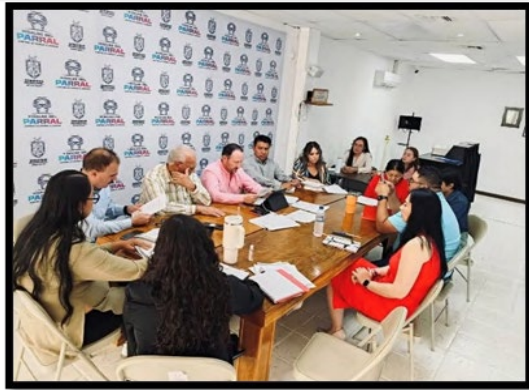
Mesa de trabajo centrada en el análisis de las observaciones de irregularidad hechas por la Sindicatura