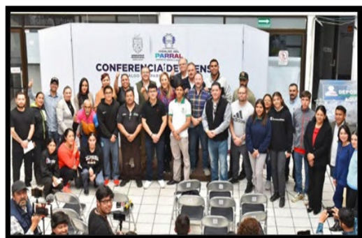
Entrega de Becas a Deportistas de diferentes categorías